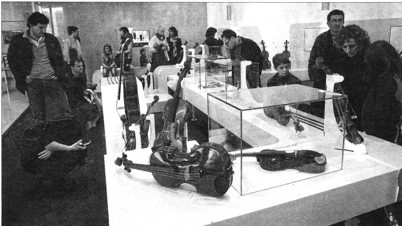
Varias personas observan los violines, violas y cellos expuestos. MIGUEL ÁNGEL MONTESINOS